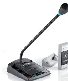
S-520 с симплексом и кнопкой вызова