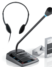
S-411 с наушниками