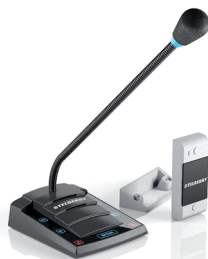
S-410 базовая модель