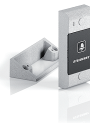
S-120 панель с кнопкой вызова