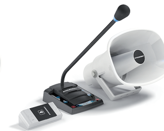
S-525 с симплексом и кнопкой вызова