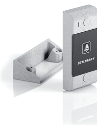
S-130 панель с кнопкой вызова и встроенным реле