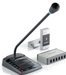
S-660 1+6 - канальное переговорное устройство для АЗС