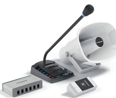
S-665 1+6 - канальное переговорное устройство для АЗС с рупором