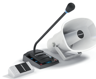
S-505 базовая модель