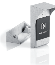
S-135 всепогодная панель с кнопкой вызова и встроенным реле