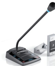
S-420 с кнопкой вызова