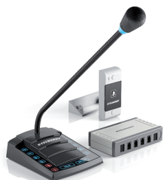
S-640 1+4 - канальное переговорное устройство для АЗС