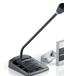
S-510 с симплексом