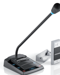
S-500 базовая модель