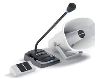
S-515 с симплексом