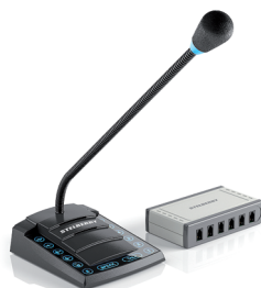
S-760 6-канальное переговорное устройство