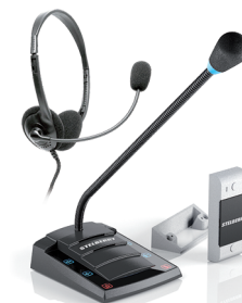
S-402 с гарнитурой