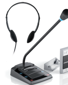
S-401 с наушниками