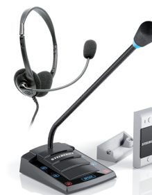
S-412 с гарнитурой