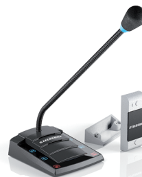
S-400 базовая модель